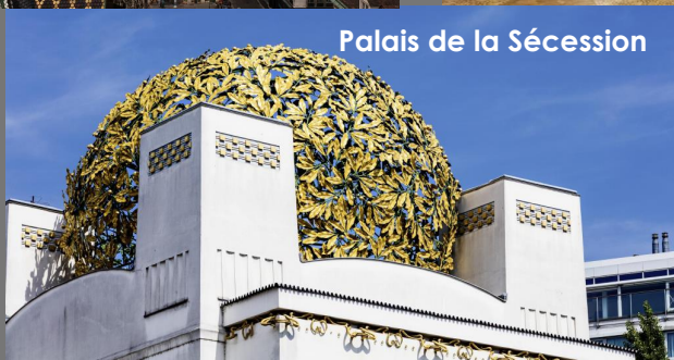
Palais de la Sécession