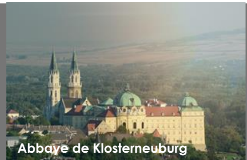
Abbaye de Klosterneuburg